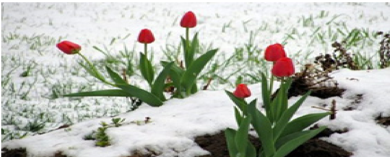
پەيامى كۆمىتەى ناوہندى كۆمەلە بەبۆنەى نەورۆز و دەستېكى سالى ۱۴۰۳

حكومەتى ئىسلامى سەرمايەداران بۆ جارىكى دىكە سالى تازەى بە ديارىكردى حەقدەستى چەند بەرابەر ژېر ھىلى ھەژارى و بە ھېرشكردەنەسەر سفىرى بەتالى بنەمالە كرىكارىيەكان دەستېكرد. دواى چەندىن ھەفتە وتوېژى نوپنەرانى دەولت، نوپنەرانى سەرمايەدارانى بەشى خسوسى و نوپنەرانى رېڭخراوہ زەردە كرىكارىيەكانى سەربە حكومەتى ئىسلامى لە شۆراى بالاي كار، ئەم ناوہندە دژە كرىكارىيە ناستى زىادكردى لانيكەمى حەقدەستى كرىكارانى بۆ سالى ۱۴۰۳، سى و پىنج لەسەد راگەياند. بەپىي ئەم بريارە، لانيكەمى حەقدەست لە سالى ۱۴۰۳ دواى زىادكردى ۳۵ لەسەد، لە ۵ مليون و ۳۰۸ ھەزار تەنەوہ بۆ ۷ مليون و ۱۶۶ ھەزار تەن زىاد دەكرىت كە بە حىسابكردى بۆنى خاروبار، كۆمەك ھەزىنەى مەسكەن و مەزايای دىكە، حەقدەستى كرىكاران دەگاتە ۱۱ مليون و ۵۰۰ ھەزار تەن. ديارىكردى ئەم ناستە لە لانيكەمى حەقدەست لە حالىكدايە كە تەنانەت بانكى مەركەزى پزىم پزىژەى تەوہرومى ۴۲ لەسەد راگەياندووہ و لەماوہى يەك سالى رابردوودا ھەزىنەى سەبەدى مەعشەتى كرىكاران كە خەرجى خۆراك و پۆشاك و دەرمان تا كرى مال و خەرجى ھاتوچۆ و ناموزش و تەفرىح و ... لەخۆ دەگرىت بەشىوہى بەرچاؤ زىادىان كرووہ. لە بارودۆخى ئىستادا بەلەبەرچاؤگرتنى پەرەسەندنى قەيرانى ئابوورى و ھاتنەخوار و نەوہسانى ئەرزشى رىال بەرامبەر بە قىمەتى دۆلار، ھەزىنەى سەبەدى مەعشەتى خانەوادەيەكى كرىكارى لە تاران مانگانە بۆ سەرووى ۳۰ مليون تەن و لە شارەكانى دىكەى ئىران بۆ سەرووى ۲۵ مليون تەن بەرزبووہتەوہ.