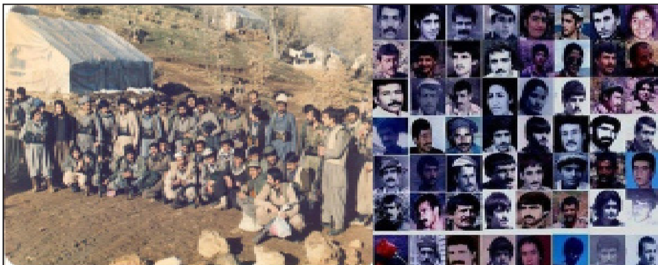
بۆ يادى گيان بەختكردووانى كۆمۇنىستى گوردانى شوان