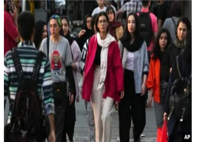
بینه مه یدان.

حیحابی ئیحیاری به سه ر ژنان وتی: "له بواری شه رعیه وه حیحاب حوکمیکه یه وه یه و بۆ خاتمان بیجگه له داپۆشینا روخسار و ده ست واجبه و ده بی ره چاو بکریت و نابی پشستگۆی بخریت". به دواي خامنه یی، موحسین ئیژه یی سه رۆکی ده زگای قه زایی رژیم روژی چوارشه ممه ۲۲ ی مانگی خاکه لپوه له م په یوه نده دا وتی: "به له به رچاوگرتنی ئه وه یکه کۆماری ئیسلامی له بواری حیحاب و عیفافه وه وه زعیکی باشی نیه و دۆخی ئه منیه تی ده روونی کۆمه لگاش باش نییه، نابی چاوهروانی په سندرانی نه یایی گه لاله ی حیحاب و عیفاف بین و پیوسته به به کاره پینانی یاساکانی ئیستا بۆ باشترکردنی وه زعی عیفاف و حیحاب هه ول به دین". وتیشی: "مانگی خاکه لپوه ی سالی رابردوو گشت یاساکانی په یوه نیدار به باشترکردنی وه زعی حیحاب و عیفافمان له ۹ ماده دا وه ک بنه مای گه لاله که په وانیه ده وه له ت و مه جلیس کرد. ده وه له ت ئه م یاسایه ی کرد به ۱۵ ماده و مه جلیس کردی به ۷۱ ماده. به لام ئیستاش به سه ره نجام نه گه یشتوه". ئیژه یی جه لاد داواي له دادستانه کان و فراجا و وه زاره تی ناوخۆ کرد که چاوهروان نه بن و دژه ژنان