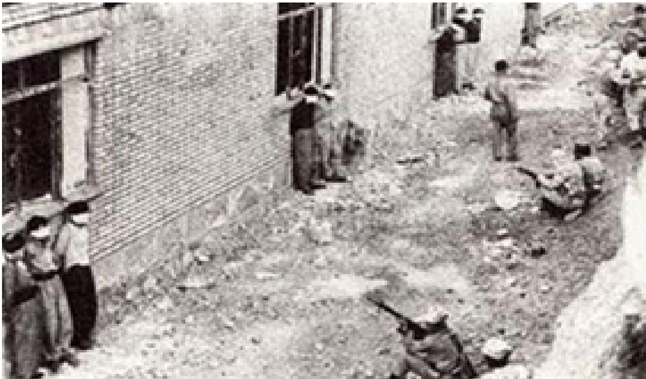
بۆ يادى ۵۹ لوى گيانبەختكردوى شارى مەھاباد

ئەمجارەيان ئەگەر نەمانەھوى شۆرشى داھاتووى ئىران چارەنووسى راپەرىنى ۵۷ بەسەر بىت، پىويستە ھەر لە ئىستائو پىداويستىيەكانى داينگرتنى رېتەرى