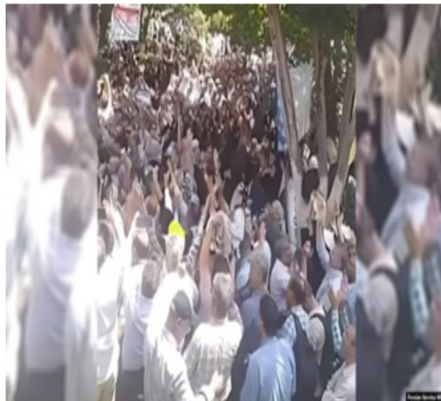
ناپه زایه تییان بهرپاکرد.

ناپه زایه تی شه قامی خانه نشینانی فهره نگی و غه یری فهره نگی له ماوه ی ههفته ی رابردوو له شاره کانی دیکه ش درپژه ی بوو. رۆژی دووشه ممه ۲۱ی مانگی جوژهردان خانه نشینانی موخبرات له شاره جوړاو جوړه کانی وهک پهشت، خورهم ئاباد، ئیسفه هان، تاران، زه نجان، بهنده رعباس، بیچار، سنه، تهو ریز و چهند شاری دیکه کۆبوونهوه ی ناپه زایه تی سه رتاسه رییان بهرپوه برد. رۆژی سێشه ممه له کرماشانیش خانه نشینانی موخبرات، ته غینی ئیجتماعی، علومی پزیشکی به شیوه ی هاوبه ش کۆبوونهوه ی