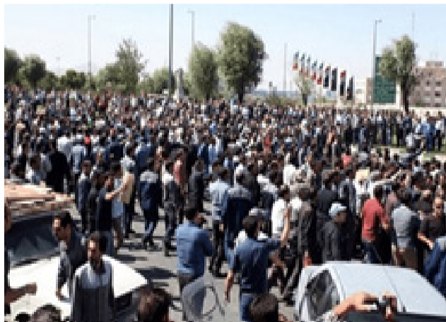
خانه‌ی کاریگر و شوری ئیسلامی و هیت، بووه

مانگرتن و نارپه‌زایه‌تی کریکاری به شیوه‌ی راگرتنی کار و راگرتنی چهرخی به‌ره‌مه‌پنډان و کوبوونه‌وه له ناوهنده‌کانی کار یان له‌به‌رده‌م داموده‌زگا حکومیه‌کان پوژانه له سهرتاسه‌ری ئیراندا به‌رده‌وامه. پوژانه شایه‌دی مانگرتن و نارپه‌زایه‌تیبه کریکاریه‌کانین. نه‌گه‌رچی مانگرتن و به‌ریو‌بردنی کوبوونه‌وه‌ی نارپه‌زایه‌تی لای رژیمی کوماری ئیسلامی حهره‌که‌تیکي پیچ‌ه‌وانه‌ی یاسایه، به‌لام کریکارانی ئیران ساله‌هایه مانگرتن و نارپه‌زایه‌تی نیاسایی خوین کردووه‌ته واقعیه‌تیکي حاشاه‌لنه‌گری بزووتنه‌وه‌ی کریکاری و کومه‌لگای ئیران. له ماوه‌ی سالانی ده‌سه‌لاتی ئه‌م رژیمه‌دا، به‌رده‌وام یاسای کار نووسراوه‌ته‌وه و ته‌بسه‌ره و تیبینی جوراوجوری پي زیاد کراوه و یان لئی کمه کراوه‌ته‌وه. به‌لام له هیچ‌کام له‌م پيشنوس و په‌سندکراوانه‌دا، ته‌نانه‌ت یه‌ک جاریش وشه‌ی "مانگرتن" به‌کار نه‌بردراوه. ده‌لئی وها حهره‌که‌تیک له کومه‌لگای ئیراندا، بوونی نییه. به‌لام سهره‌پرای حاشالیکردن و په‌رده‌پوشی رژیم، مانگرتنی کریکاری، به‌رده‌وام کابوسی ده‌زگانانی سهرکوتی راسته‌وخو، له وه‌زاره‌تی ئیتلاعات و ئیتلاعاتی سپا، فرماندار و ئوستانداره‌کانه‌وه بگره‌تا ناوهنده‌کانی سهرکوتی ناراسته‌وخو، له‌وانه‌ریک‌خراوه‌ دژه کریکاریه‌کانی وه‌ک