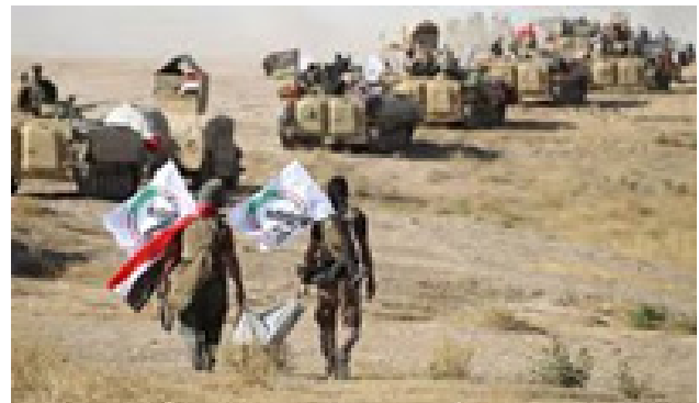
حەشدى شە‌عبی ۵۳۷ ملیارد دینار بووه.

و زەحمە‌تكێشی عێراقیان بە‌ره‌و‌ڤووی هە‌ژاری و نە‌هامە‌تی بە‌درووه. هەر كام لە‌و گرووپانە دە‌فتەر و قە‌رارگا و هە‌زاران بە‌كریگراوی چە‌كداریان هە‌یه. مووچە و شوینی نیشته‌جێ بوونیان بۆ هێزە‌كانیان و بۆ بنە‌مالە‌ی كۆژراو و بریندارە‌كانیان تە‌رخان كرووه و خاوه‌نی كە‌ره‌ستە‌ی نێزامی و چە‌كی مۆ‌دێرن و مانگانە دە‌یان ملیۆن دۆلار لە‌ بوودجە‌یان بۆ تە‌رخان دە‌كړیت. ئە‌ندامێکی كۆمیسێونی ئە‌منیه‌ت و بە‌رگری پەرلە‌مانی عێراق ئاشكراي كە تە‌نیا بوودجە‌ی رێكخستنی