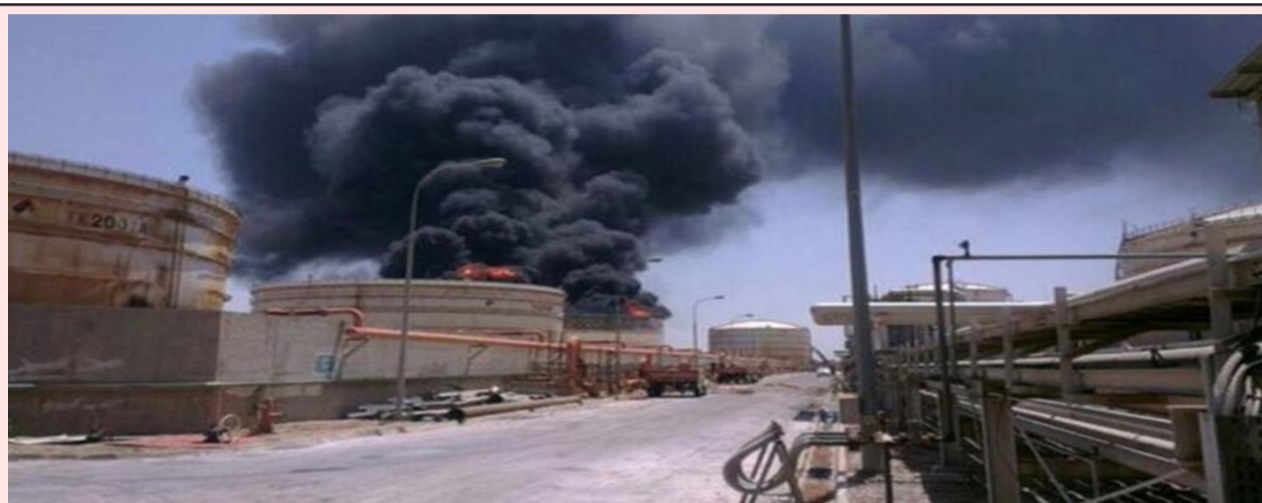
عەسەلوویە لە ژىر ئاگرى شەردا

لە ئاكامى ئەم شەرەدا كە نىكەى مانگىكە درىژەى ھەيە، تا ئىستا نىكەى دوو ھەزار كەس لەوانە زياتر لە ۲۰۰ مندال لە ئىران گيانان لەدەست داوھ. زياتر لە ۱۶۰ كەس لەو مندالانە ھەر لە يەكەمىن رۆژى شەرەكەدا و لە ھىرشى مووشەكى ئەمريكا بۆ سەر قوتابخانەيەكى كچان لە شارى میناب گيانان لەدەست داوھ. بەھۆى برىنى ئىنتەرنىتتەوھ، لە ۲۸ فېبرىيەوھ پىوھندىي ۹۰ مىيۆن كەس لە خەلكى ئىران لەگەل جىھانى دەروھ پچراوھ و دەيان ھەزار كەس كار و پىشەى خۆيان لەدەست داوھ. سەرەپاى ئەوھش، تا ئىستا ھەزاران بالەخانەى نىشتەجىبوون، نەخۆشخانە، قوتابخانە، يارىگا، كوگای وزە، ژىرخانە كانى ژيان و بىنا مەدەنىيەكانى دىكە زىيانان بەركەوتووھ. لە ھىرشە مووشەكییەكانى كۆمارى ئىسلامى بۆ سەر ئىسرائىلىش تا ئىستا دەيان كەس كوژراون و زياتر لە پىنج ھەزار كەس برىندار بوون. لە لوبنان، تا ئىستا زياتر لە ۱۱۰۰ كەس كوژراون و زياتر لە سئ ھەزار كەس شىش برىندار بوون، كە نىكەى سەدا سىي كوژراوھكان مندالان و ژمارەيەكى زۆرىش كادرى پزىشكىن، ھەرۆھەا نىكەى يەك لەسەر پىنجى دانىشتووانى لوبنان ئاوارە و دەربەدەر بوون. كاتز، وەزىرى بەرگىي ئىسرائىل، خوازيارى خاپووركردنى